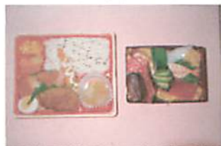
洋風幕の内 ちらしずし